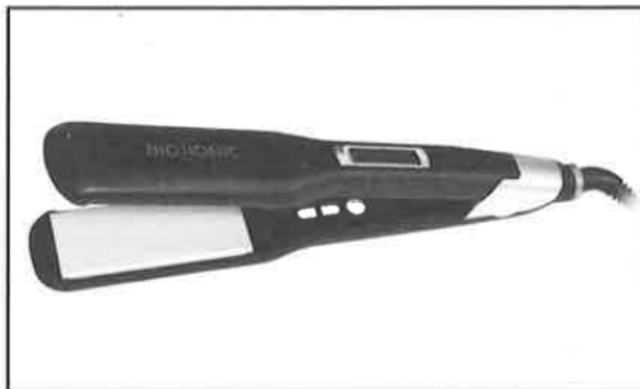
MODEL GoldPro™ SMOOTHING & STYLING IRON 1,5“

Děkujeme Vám za zakoupení Bio Ionic GoldPro™ SMOOTHING & STYLING IRON 1,5“.